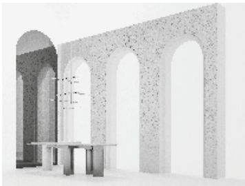
Merletto Bianco Sivec - pag. 36