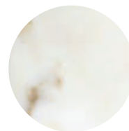
Bianco del Re